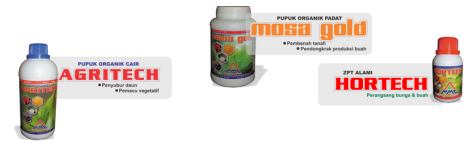
Fig. 1 - http://surl1.de/76mS

[s. Fig. 1] Pemupukan menggunakan Pupuk Organik Cair AGRITECH , Hormon Organik HORTECH , dan Pupuk Organik Padat MOSA GOLD . Pemupukan dilakukan pada umur 1 minggu, 3 minggu, 7 minggu. Pe-