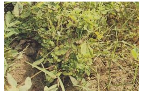
Fig. 1 - http://surl1.de/hj2b

[s. Fig. 1] Penyakit ini disebabkan oleh virus dan disebarkan oleh vektor kutu daun ( Aphis sp). Gejala penyakit yang terserang virus menunjukkan bentuk tanaman dengan cabang seperti sapu.